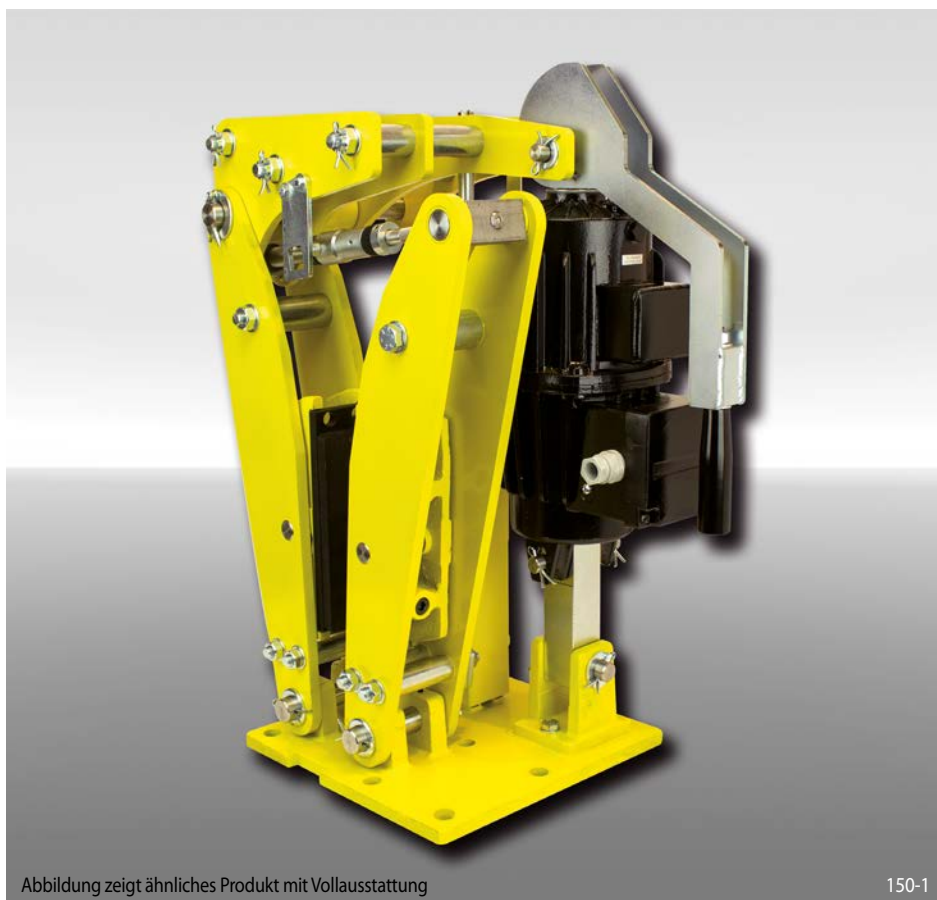
Abbildung zeigt ähnliches Produkt mit Vollausrüstung

federbetätigt – elektrohydraulisch gelüftet