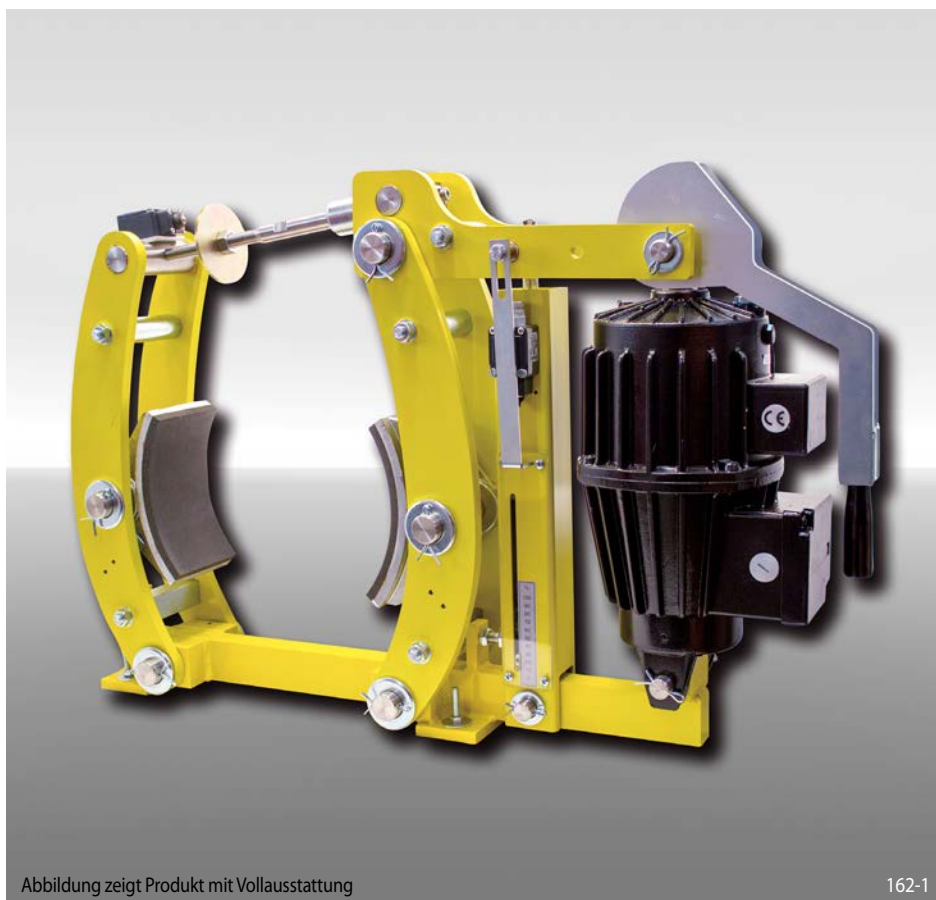
Abbildung zeigt Produkt mit Volllausstattung

federbetätigt – elektrohydraulisch gelüftet Trommelbremse nach DIN 15 435