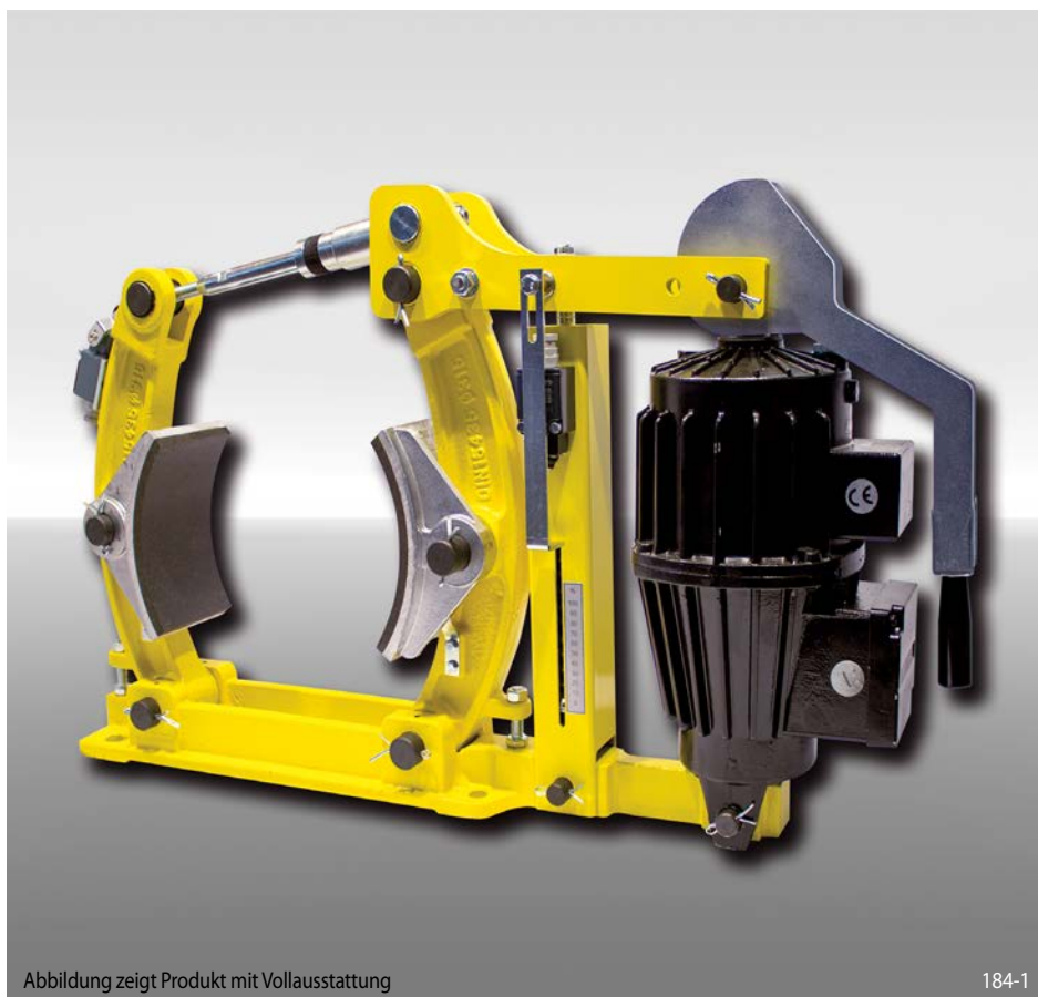
Abbildung zeigt Produkt mit Volllausstattung

federbetätigt – elektrohydraulisch gelüftet Trommelbremse nach DIN 15 435